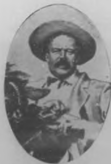
General Porfirio Villa, jefe del Ejército revolucionario.

El glorioso de la guerra, aunque heroica, despierta por cariño de raza compasión. Es la más grande desgracia para su pueblo.