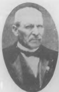
General Victoriano Huerta, Presidente interino de México.