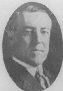
W. Woodrow Wilson, Presidente de los EE. UU.