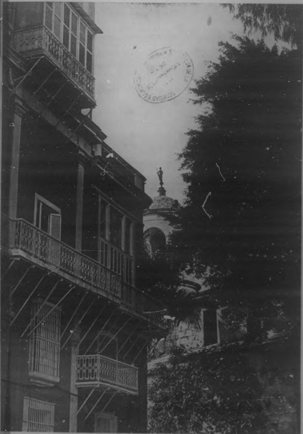
EL CASTILLO DE LA FUERZA.—Estudio artístico de Martínez.