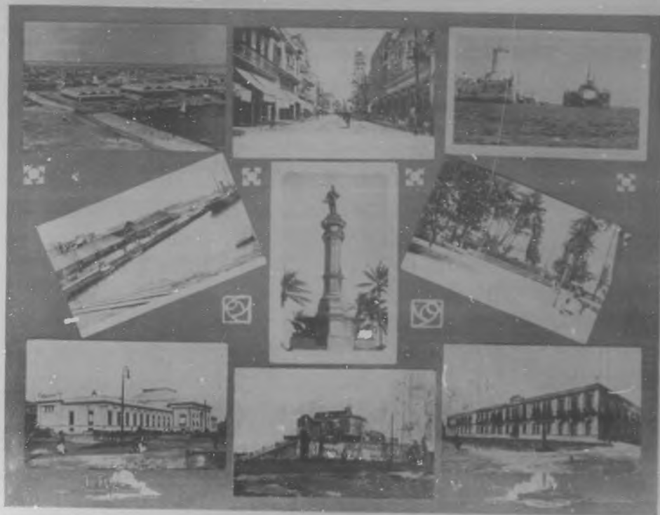
Los sucesos de Méjico. — 1. Vista Panorámica de Veracruz por el Bosque. — 2. Cibe Independencia, primer avión adquirido por las fuerzas americanas. — 3. San Juan de Uta y Doria, fuerzas aéreas. — 4. Vista del Museo Naval donde está colocada la artillería americana. — 5. Muelle de Juárez. — 6. Estatuas