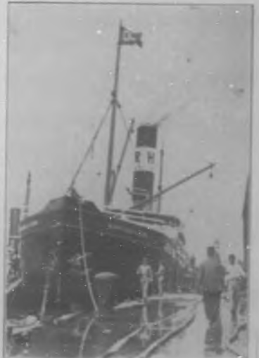
EN HABIA.—El buque vapor "Santiago de Cuba" de la casa de los "Hermanos de Herrera" durante el momento oportuno de sus viajes y finalmente arribado por nuestros servicios bohemios.

Después de un estudio concienzudo, por dos años, fundó en Paríseus los "Conciertos clásicos", de gran recuerdo, dirigió luego la banda "El Dosyote" y en el Departamento de la "Dardagna" fue delegado de la "Asociación de Jurados Or-