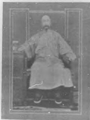
JAO JU-KUA Viajero Chino.

Los productos de Mu-lam-pi son: extrañas y varias clases de trigo, cuyas espigas miden más de tres pul-