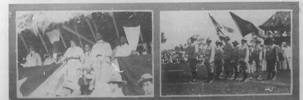
EJERCICIOS EN LA MOCHA - El señor Presidente de la República, su distinguida señora, el General Freyre y otras personalidades en la tribuna viendo los ejercicios militares. - Acto de desfile de banderas por delante de la tribuna.