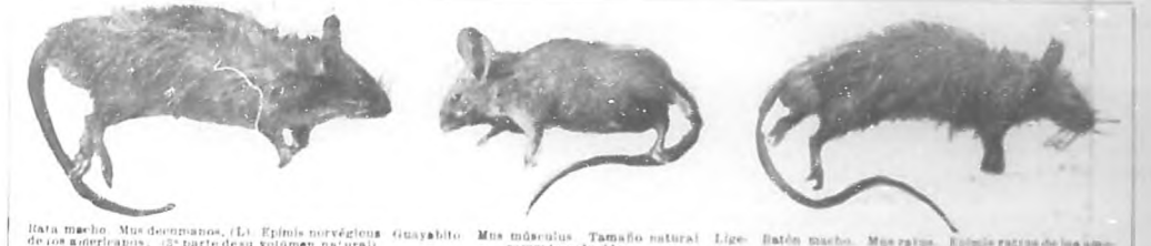
Itata muelo. Mus doormanus. (L) Epimus norvegicus de los americanos. (R) parte del volumen natural. Guayabito. Mus musculus. Tamaño natural. Ligamento reducido. Raton muelo. Mus ratus. Epimus ratus de los americanos. (L) parte del tamaño natural.

A la vista tenéis la ruta seguida por esa pandemia terrible, solo comparable en sus