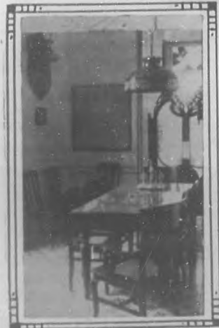
Salón privado para conferencias.