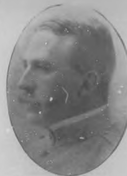
GENERAL LEONARDO WOOD, Jefe del Ejército de operaciones en Méjico.