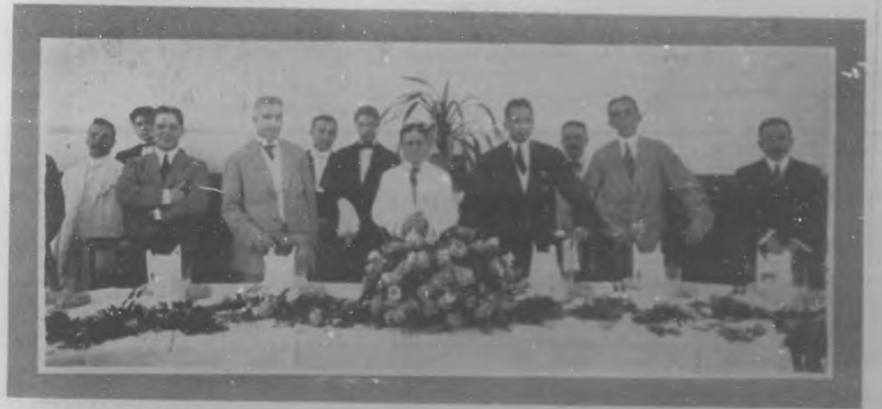
ALMUERZO DE LOS REPORTERES.—Vista de la presidencia del almuerzo celebrado por los redactores de la Prensa Diaria, con motivo de la toma de posesión de la nueva directiva, celebrado en el Hotel Sevilla.